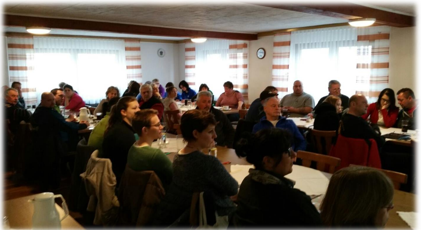
Ein Teil unserer neuen "Übungsleiter"