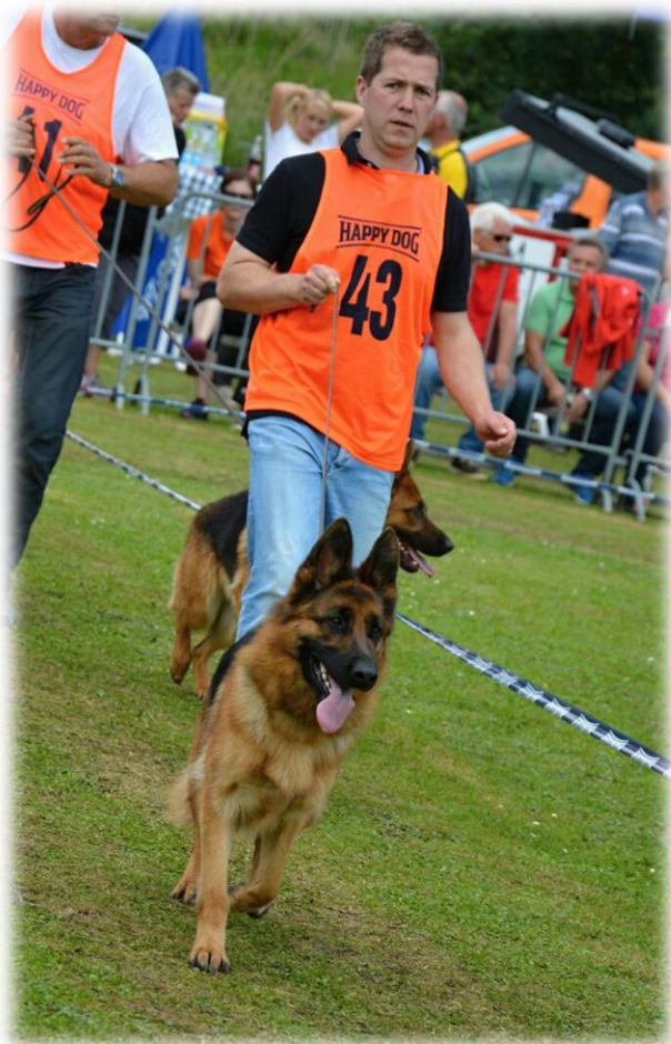
SG 1 JHKLH Destiny vom Aurelisbrandt