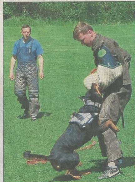
Abfangtechnik wird erlernt.